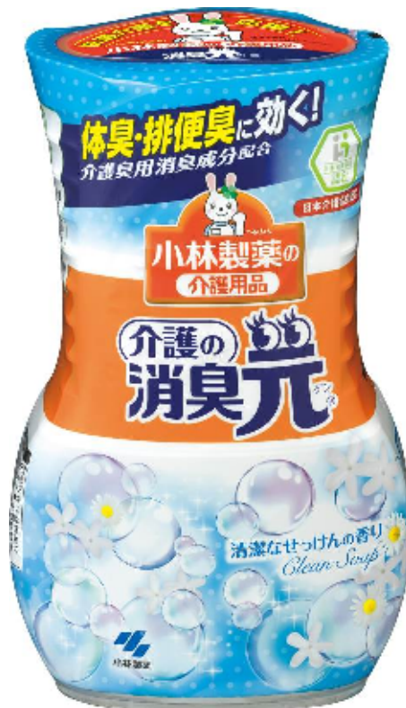
「介護の消臭元」 オープン価格 400mL

小林製薬株式会社（本社：大阪市、社長：小林 章浩）は、介護特有のお部屋のニオイを効果的に消臭する「介護の消臭元」を10月6日（木）から全国の薬局・薬店、スーパー、ホームセンターなどで発売いたします。