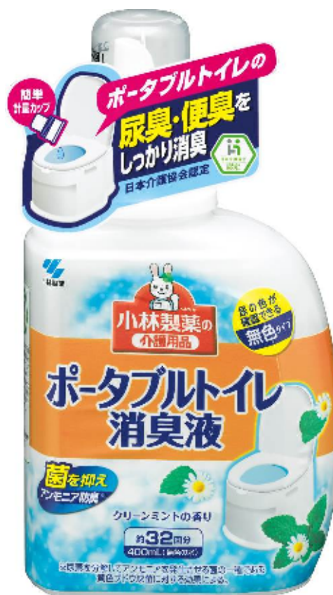
「ポータブルトイレ消臭液」 オープン価格 400mL